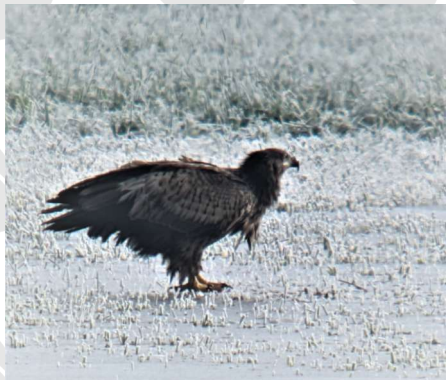
Pygargue à queue blanche

(Observations communiquées par le groupe « Biodiversité » de l'AMD)