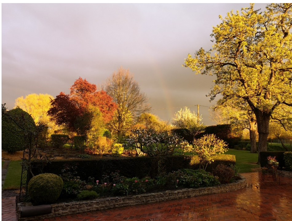
Marc Gautron 1er prix adulte